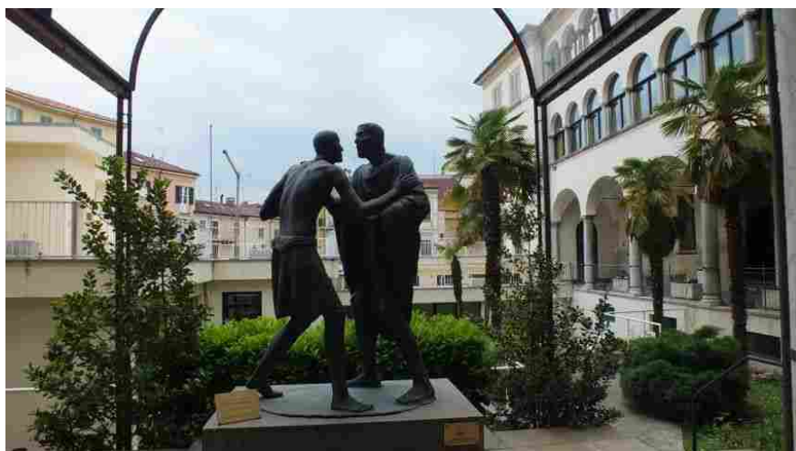
Casa di riposo Ottolenghi di Acqui Terme