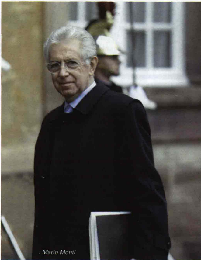
› Mario Monti