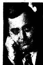
Vittorio Messori La sua prima opera di grande successo fu «Ipotesi su Gesù»