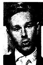
Antonio Pennacchi Giuria unanime: suo il miglior romanzo «Canale Mussolini»