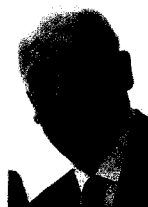
Sandro Bondi E' ministro ai Beni culturali ed è novese di adozione