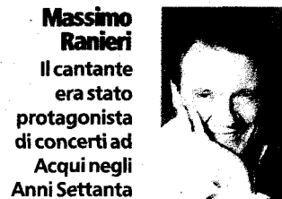
Massimo Ranieri Il cantante era stato protagonista di concerti ad Acqui negli Anni Settanta