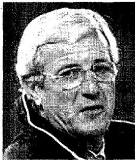
Lex mister Marcello Lippi

Azzurro. È il colore della XXXIX edizione del premio letterario Acqui Storia, nato nel 1968 per ricordare l'eccidio della Divisione Acqui a Cefalonia nel 1943. Alla Nazionale di calcio campione del mondo, a Marcello Lippi e Gianluigi Buffon è stato infatti assegnato il riconoscimento «testimoni del tempo». «Il successo - si legge nel-